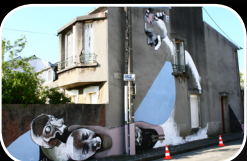
EPISODE #1 : BEST EVER (UK) 35, rue Duchesse Anne (Quartier St Marc)