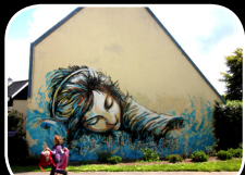
EPISODE #3 : ALICE PASQUINI (IT) 8, rue Shakespeare/Rue de Guilers (Quartier Cavale Blanche)