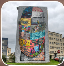
EPISODE #7 : DMV (FR) 11, rue Fonck/Rue Galliéni (Quartier Quéliverzan)