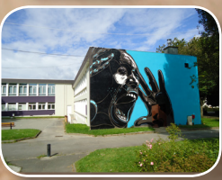
EPISODE #3 : C215 (FR) 13, rue Professeur Chrétien (Quartier Pen Ar Créac'h)