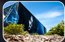
EPISODE #11 : PAKONE (FR) Rue Edouard Belin/Bd Europe (Quartier Europe)