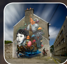
EPISODE #12 : BOM K/LILIWENN (FR) 2, rue Pen Ar Run (Quartier Kérinou)