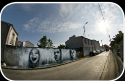
EPISODE #1 : BEN SLOW (UK) 35, rue Duchesse Anne (Quartier St Marc)