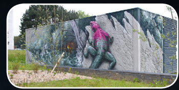
EPISODE #10 : TSF (FR) Rd point Coat An (Quartier St Pierre)