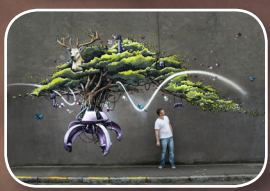
EPISODE #6 : WEN2 (FR) 2, rue Pierre Riquet (Quartier Kérinou)