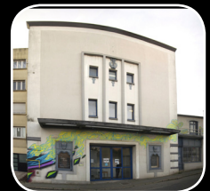
EPISODE #9 : KOOL KOOR (US) 143, rue Robespierre (Quartier Kérinou)