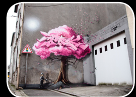
EPISODE #8 : PAKONE (FR) 52, rue Mathieu Donnard (Quartier Kérinou)