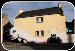
EPISODE #4 : LILIWENN (FR) 33, rue Yves Giloux (Quartier Lambézellec)