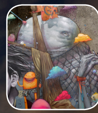
EPISODE #12 : BOM K/LILIWENN (FR) 2, rue Pen Ar Run (Quartier Kérinou)