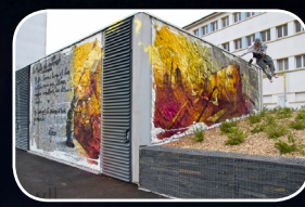
EPISODE #10 : SLY2 (FR) Rue Natalini (Quartier Europe)