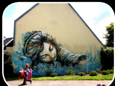
EPISODE #3 : ALICE PASQUINI (IT) 8, rue Shakespeare/Rue de Guilers (Quartier Cavale Blanche)