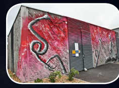
EPISODE #11 : CELESTE JAVA (FR) Rue Kervézennec/Rte Gouesnou (Quartier Europe)